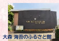
大森 海苔のふるさと館

1963 年春、東京都沿岸での海苔養殖は 長い歴史に幕を閉じましたが、 江戸時代中頃から作り始められた大田区 海辺の海苔は、味・量ともに 全国一を誇りました