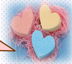
ハート型バスボム